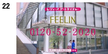
22 NA:ピンでとめないウィッグ フィーリンは 0120-52-2020. 52-2020