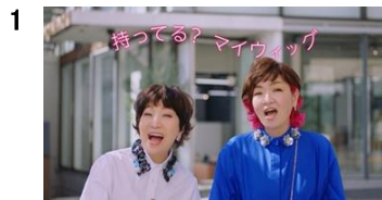
お2人:レディースアートネイチャー♪