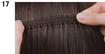
17 NA:よりたくさんの自毛をとらえるから