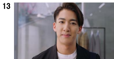
13 右近さん:いつもテレビで拝見しています。 今日も素敵ですね。