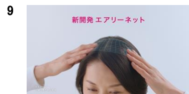
NA:新開発のエアリーネットは 通気性バツグン。