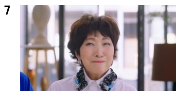
森山さん:そう？ NA:新しいフィーリンなら