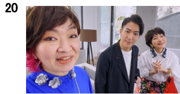
20 NA:だから近づいても大丈夫