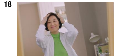
18 NA:サツとのせてキュッキュで きれいにキマる。