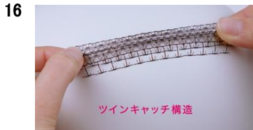
16 NA:ツインキャッチ構造で