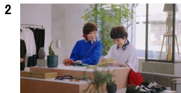
森山さん:あっ！これ、いい！ 清水さん:あっ、いいんじゃない？