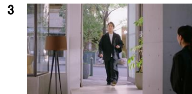
店員:いらっしゃいませ。