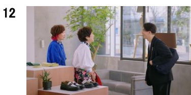
お2人:こ、こんにちは！！