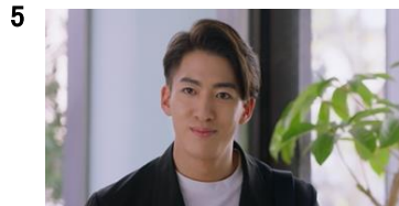
森山さん:嘘でしょ…！