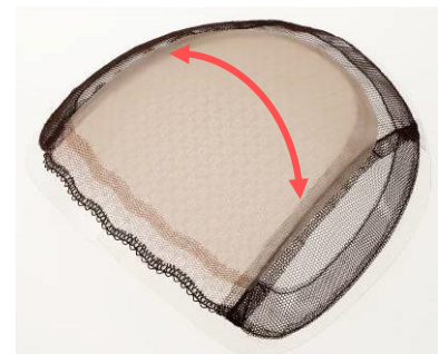
幅広スキンネット

カールやスタイルのキープ力が高い人工毛「エアファイバー」と厳選した人毛をバランスよくミックスし、根元からふんわり立ち上がり、毛流れがアップ。結び目が目立たない卓越した植毛技術と、肌ざわりにもこだわった三層構造のスキンネットで、見た目にもナチュラルに。また、幅広のスキンネットは、自由に分け目を変えられるため、多彩なヘアスタイルをお楽しみいただけます。