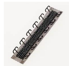
「クリップキャッチ」