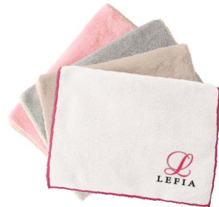
「LEFIA」ロゴ入りセームタオル