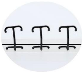
自毛をキャッチする T字状の「クリップ」

「クリップキャッチ」は、T字部分で自毛をからめてしっかりキャッチ。さらに、キープ力を強化したセンター部分の「NEWサポートタッチ」との2段階構造でフィット感がアップ。キュツ、キュツとするだけで、簡単に装着でき、一日中、快適にお過ごしいただけます。