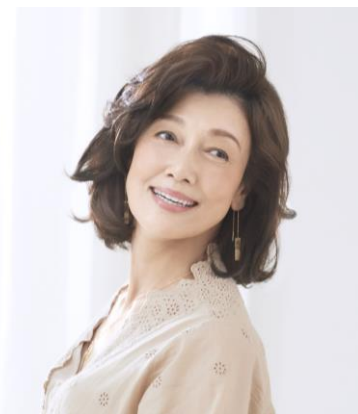
レフィア カレン LL