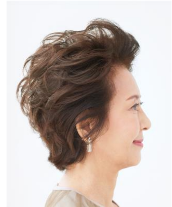
後頭部の丸みもキープ！

手触りの自然さや耐熱力にもこだわった新毛髪「エアファイバー」を採用。ご自宅のヘアアイロンなどでスタイリングしたヘアスタイルも、これまで以上にキープ力がUPしました。