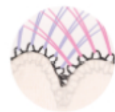
クロス植毛 イメージ図