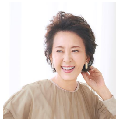
レフィア カレン FU