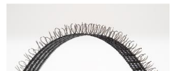
サポートタッチ イメージ図

自毛をしっかり安定させる「サポートタッチ」を採用し、ウィッグ初心者の方も簡単に装着できるように、ピンを減らしました。