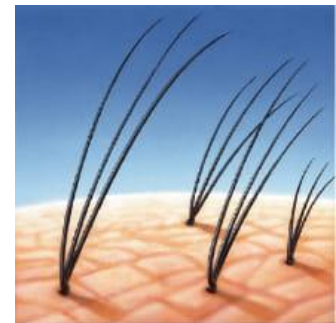
※シングル増毛結着イメージ

アートネイチャーの増毛ブランドである「MRP(マープ)」は、自分の髪にリアルな人工毛を結んで毛髪を確実に増やすことによる自然な仕上がりや自由度の高いヘアスタイリングが人気です。増やす部位、本数、人工毛の種類、髪色が選べる緻密な増毛技術は進化し続けています。