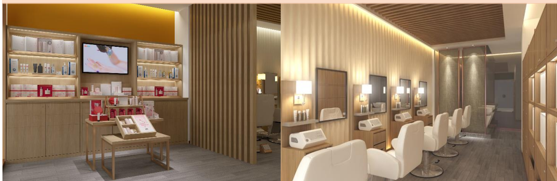
Hairology 社 ヘッドスパサロン(店舗イメージ図)