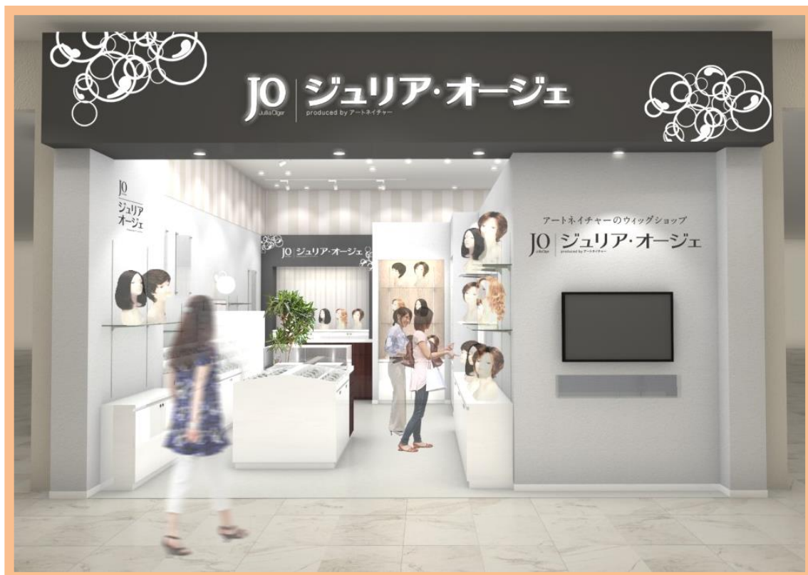
ジュリア・オージェ エミフルMASAKI店 ※イメージ図