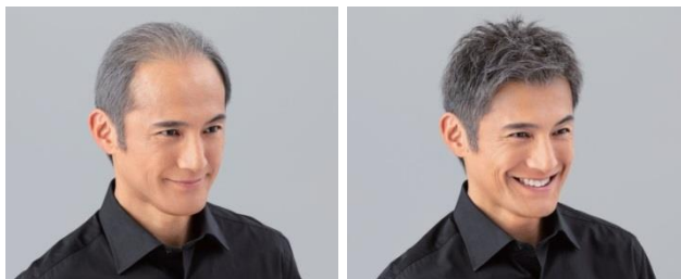
(ヘア・フォーライフ 増毛例)

『太めの毛髪(0.1mm)』を混ぜ込んだことで、毛髪の根元がつぶれにくく、ふんわりと自然なボリューム感が長続きます。また、高度な植毛技術によってうぶ毛まで再現した自然な生え際でおでこをだしたヘアスタイルにも自信が持てます。