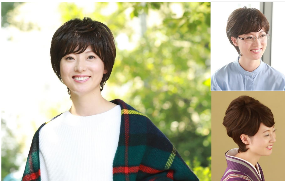
『アマダショート』使用例

アレンジしやすく耳にかけやすいデザインで、マスクやメガネの邪魔をしません。もちろん、アイロン、ホットカーラーでのスタイル変更も可能です。さらにトップを手で揉み込むと、秋風に揺れるエアリー感あるスタイリングも楽しめます。