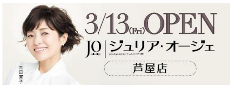
ジュリア・オージェ 大丸芦屋店 (イメージ図)