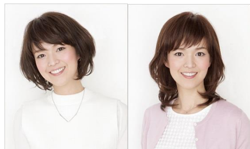
医療用ウィッグ『アックス』