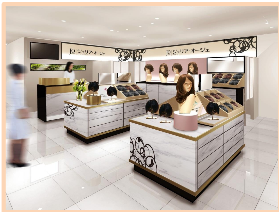
ジュリア・オージェ 大丸梅田店 (イメージ図)