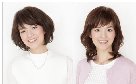
医療用ウィッグ『アックス』