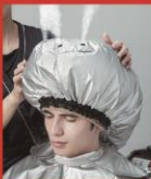
ミストサウナ (ミスティーカー)