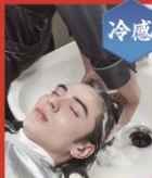
スカルプシャンプー & コンディショナー