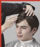
クレンジング制塗布