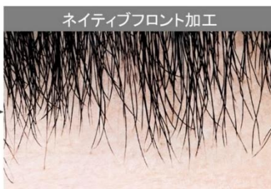
レクア ファントム