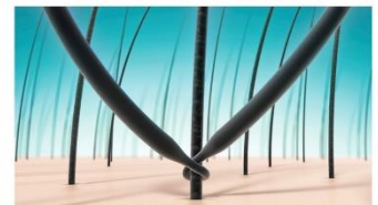
マーブ増毛 ※イメージ図