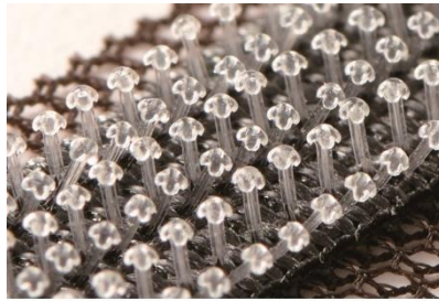
「フレアタッチ」拡大図

アートネイチャー独自の装着部材「フレアタッチ」と「クリップキャッチ」がしっかり自毛に絡み固定されます。