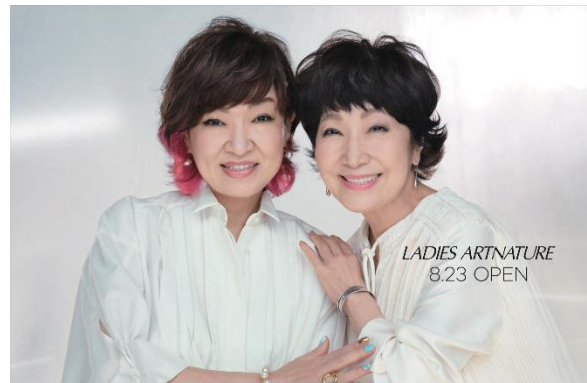
<広告ビジュアルイメージ>

『レディースアートネイチャー 三越日本橋サロン』のオープンを記念し、レディースアートネイチャーのアンバサダーとして活躍される森山良子さんと清水ミチコさんの広告ビジュアルを、日本橋三越本店、東京メトロ三越前駅コンコース内限定で初公開します。全体をホワイトでまとめ、女性らしさと凛とした雰囲気表現し、お2人の仲の良さも伝わる特別な写真となっています。ぜひ日本橋三越本店をご覧ください。